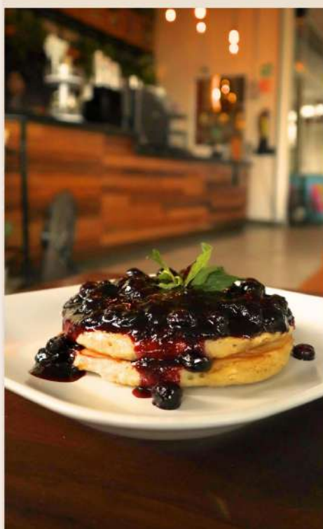
HOT CAKES BLUE BERRY