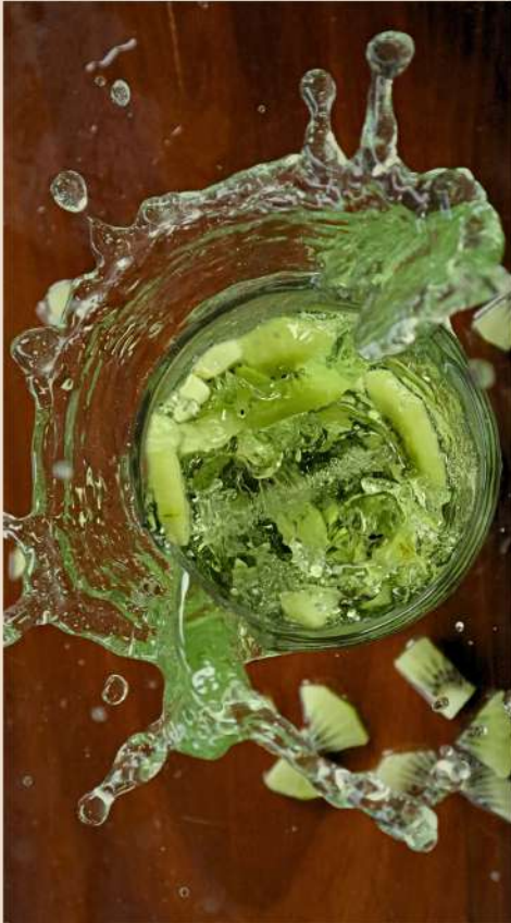
SODA ITALIANA KIWI

LIMONADA $65 LIMONADA DE FRESA $79 NARANJADA $69 NARANJADA DE FRAMBUESA $79