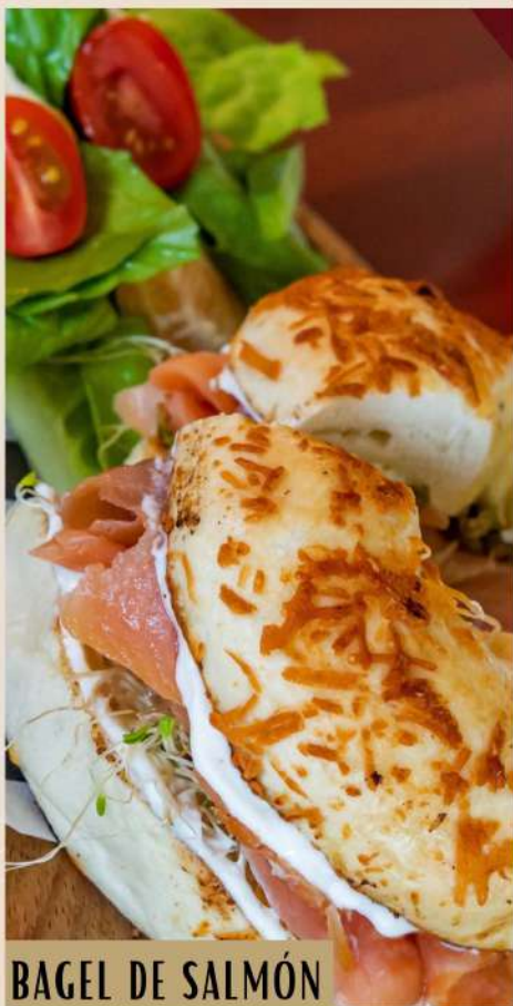
BAGEL DE SALMÓN

Pan blanco, queso crema, queso suizo, huevo estrellado, tocino, aguacate, espinaca y jitomate.