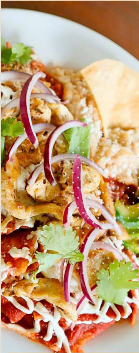
CHILAQUILES CON POLLO

BURRITO DE HUEVO O DESHEBRADA VERSIÓN MINI $60 (No incluye guarnición).