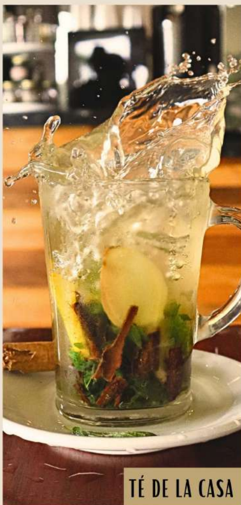
TÉ DE LA CASA