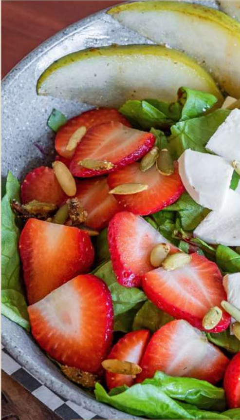
ENSALADA DE LA CASA

Base de lechuga, fresas, tomate cherry, queso mozzarella, pepita caramelizada, pera asada.