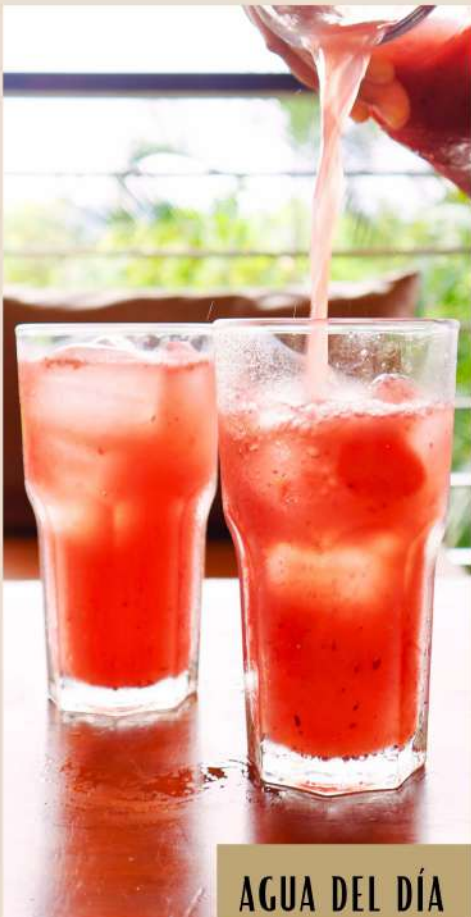
AGUA DEL DÍA