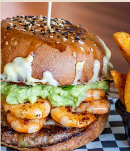
HAMBURGUESA MAR Y TIERRA