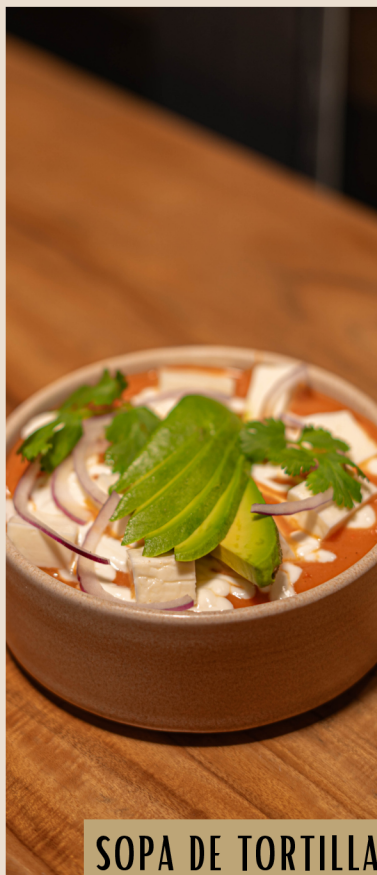
SOPA DE TORTILLA

Complemento: frijoles refritos y aguacate. Pan o tortillas de maíz.