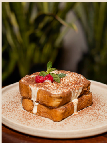
PAN FRANCES TIRAMISÚ