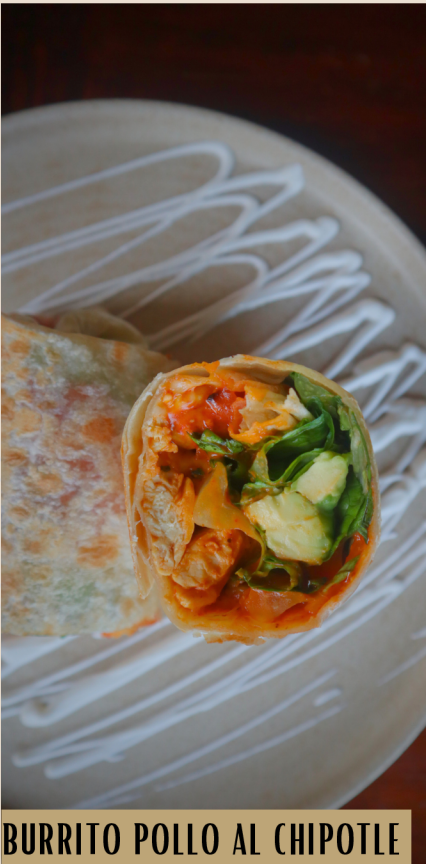
BURRITO POLLO AL CHIPOTLE