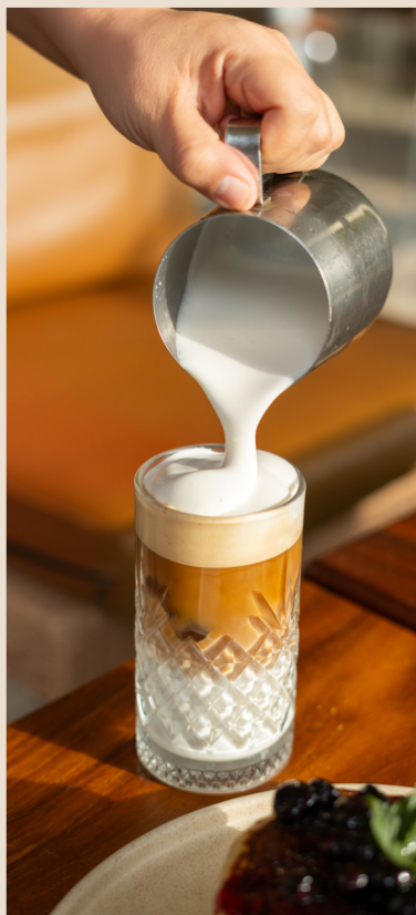
COLD FOAM VAINILLA LATTE