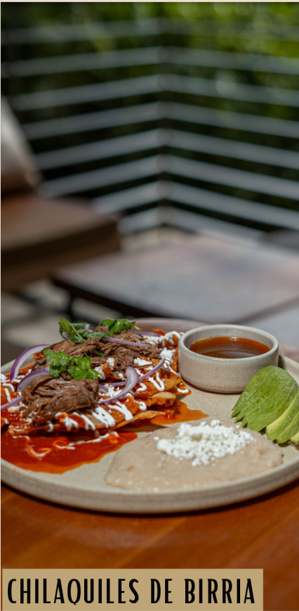
CHILAQUILES DE BIRRIA

Complemento: Aguacate y Frijoles refritos.