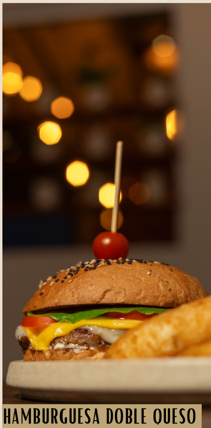
HAMBURGUESA DOBLE QUESO