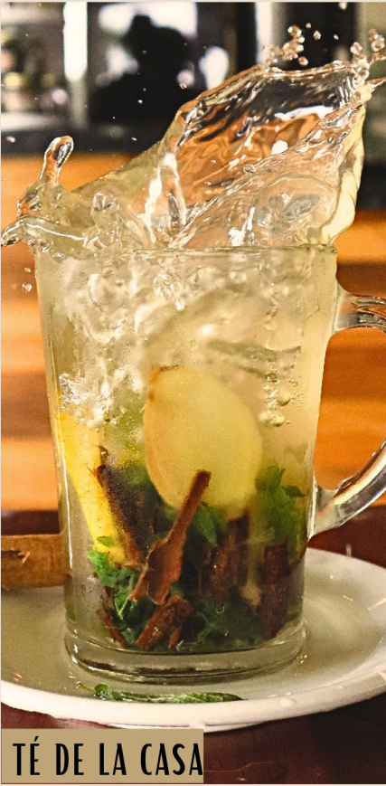
TÉ DE LA CASA