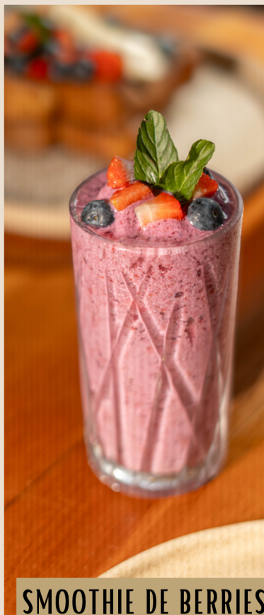
SMOOTHIE DE BERRIES